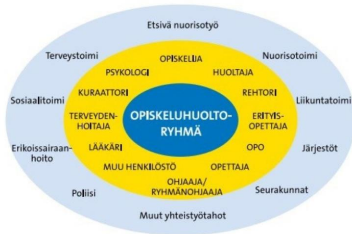
Kuvio 5. Esimerkki opiskeluhoultoryhmän kokoonpanosta (K. Laitinen, 2014).